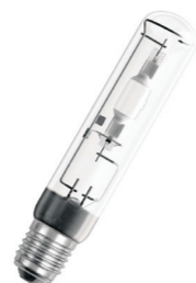
Osram POWERSTAR HQI-T