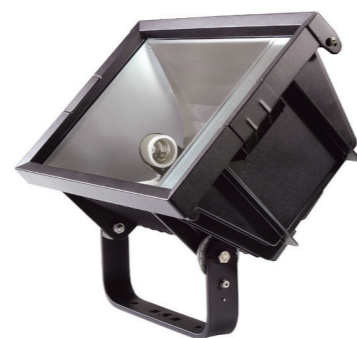
WAL 250 HPS

металлогалогенная лампа с цоколем E40 – 250W и 400W