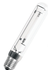
Osram Vialox NAV-T