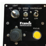
Пульт дистанционного управления для LX230RC